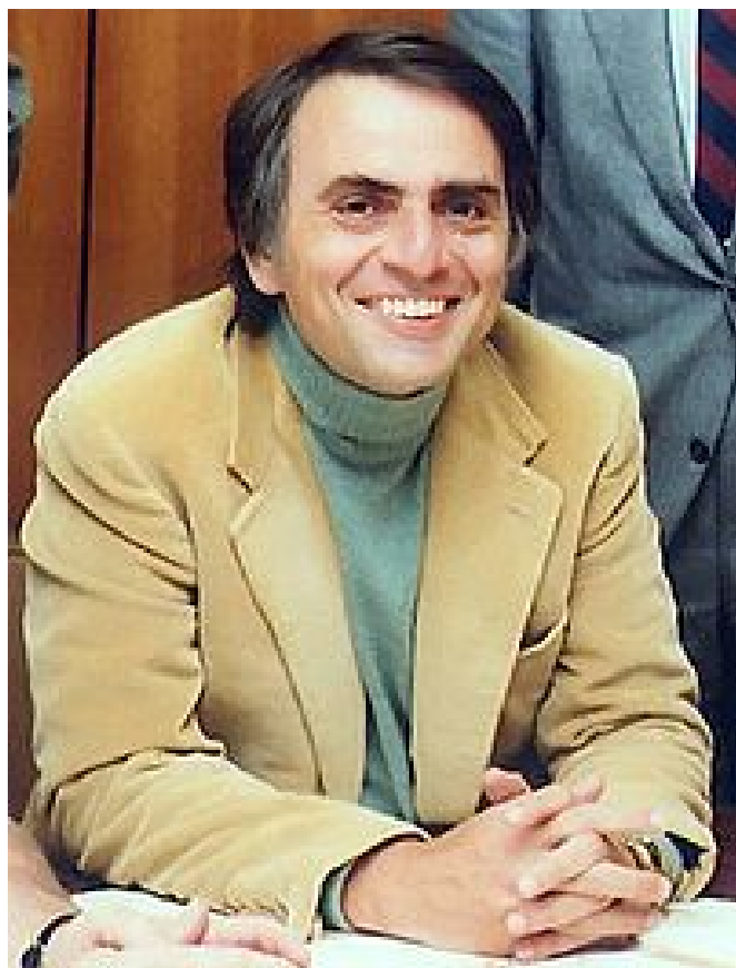
Carl Sagan, uno de los divulgadores científicos más importantes del S.XX

Reencarnación pero que el férreo control del antiguo régimen comunista no les permitía reconocerlo públicamente.