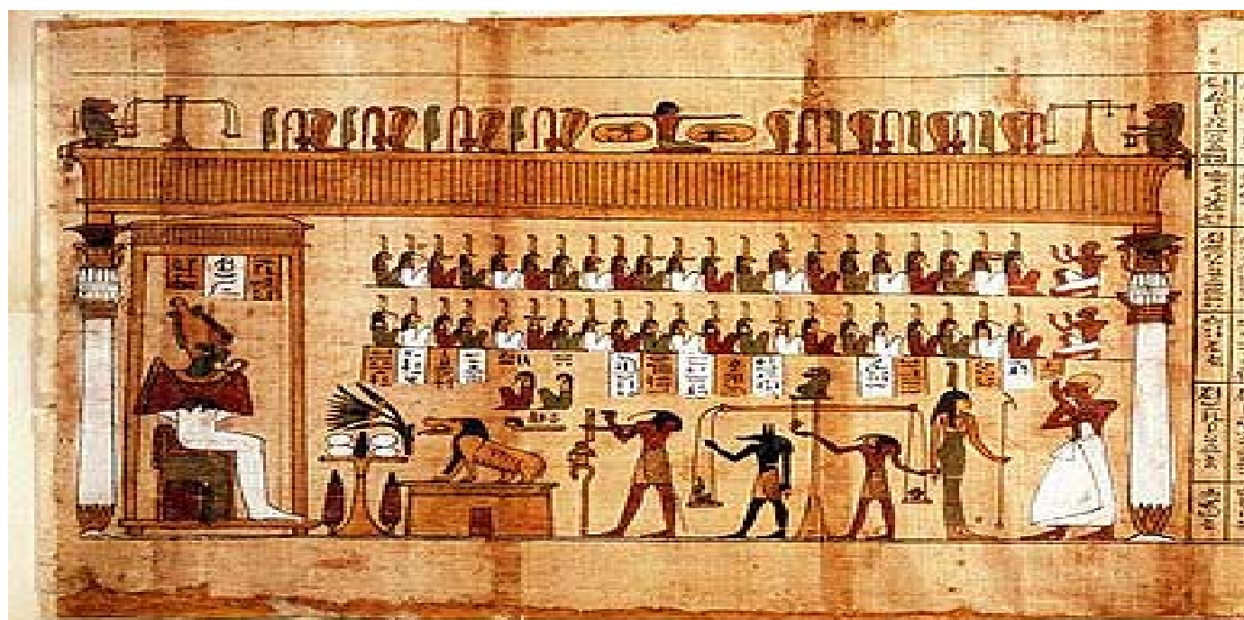
El libro de los muertos egipcio es otro de los lugares donde se habla sobre la reencarnación